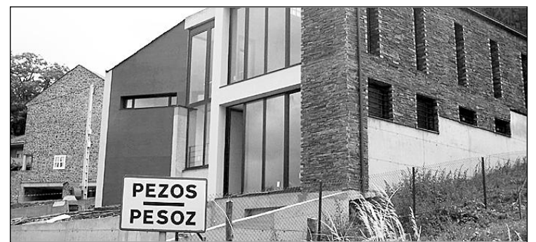
Arriba, Foso Oeste del Cabo Blanco, en El Franco. Abajo, Museo del Vino de Pesoz.