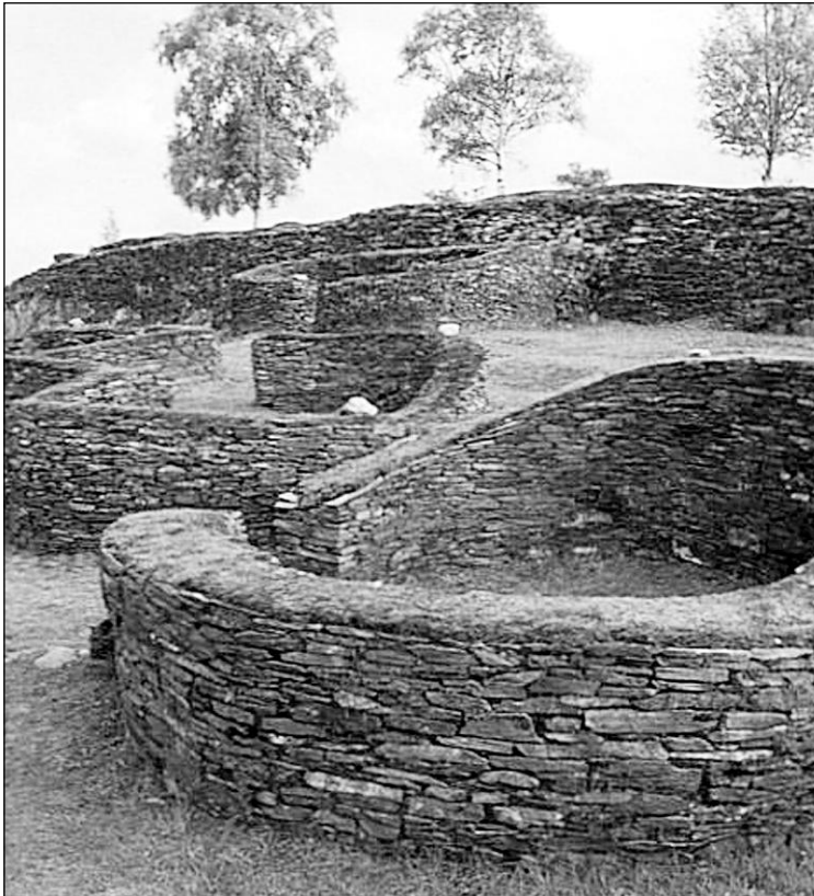
Castro de Coaña.