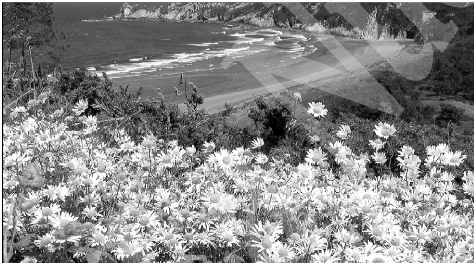
Reserva natural de Barayo.

Pasear a caballo, recorrer en piragua la ría del Navia o alguno de los embalses, hacer senderismo, descender angostos cañones o practicar el golf son algunas de las actividades que el visitante podrá realizar, sin olvidar el surf, que todos los años atrae a cientos de aficionados. Tras la acción, nada mejor que disfrutar de la buena mesa. La pesca y la caza, además de ser dos actividades que el aficionado puede practicar, suministran la materia prima con la que se elaboran los platos de la rica cocina de esta comarca. Mariscos y pescados recién salidos de la lonja, potajes de nabizas, carnes, embutidos, magníficos quesos, sin olvidar tradicionales postres como la leche frita o las mantecadas, son algunas de las viandas que puede degustar el viajero que llega a estas tierras.