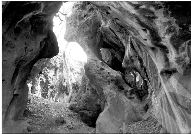
Forno del Mosqueiro.

Los testimonios más antiguos de la ocupación humana de estas tierras se remontan a hace más de 300.000 años. A comienzos del