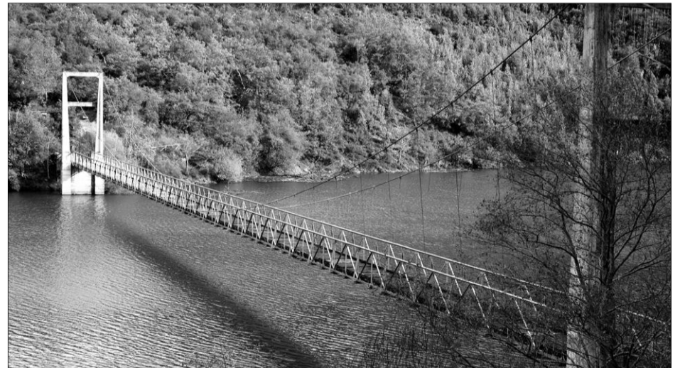
Puente colgante de Illano.