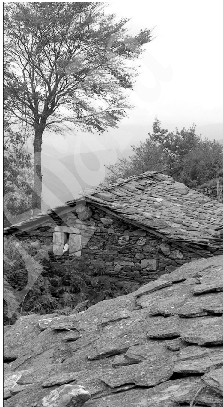
Braña de San Roque.

rrido que continúa en la cova del Demo, en Boal. Esta cueva posee un conjunto de pinturas rupestres único en el occidente de Asturias. En Boal está situado el alto de la sierra de Penouta, donde se encuentra el Penedo Aballón, singular y colosal roca. También podemos visitar el castro de Pendia. En Coaña es obligada una visita al castro del mismo nombre, sin duda el más conocido y consagrado de todos los poblados fortificados del noroeste peninsular, que cuenta con más de ochenta cabañas rodeadas de fosos y murallas y que dispone de un aula didáctica que será actualizada y mejorada para un mayor disfrute del visitante. Muy cerca están la