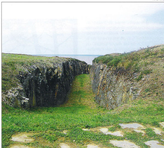
Espectacular vista del foso del Castro de Cabo Blanco

Capítulo aparte merece la mar y su relación con la comarca. Espectaculares playas, acantilados, cabos, islotes y campos de dunas se suceden para formar el sugerente paisaje de esta costa. Recoletos pueblos marineros salpican el litoral y en sus estrechas callejas, sus cuevas empinadas y sus coloridas casas, aún se cuentan historias de hombres y mujeres que viven de los frutos de un mar indómito. De estos puertos pes-