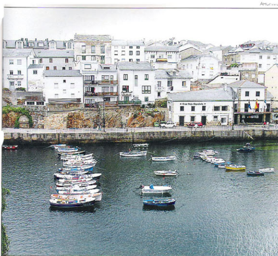
Paseo por el puerto de Tapia de Casariego

El puerto de Viavélez, en el concejo de El Franco, es un buen abrigo natural para los pescadores y un lugar de visita obligada para los turistas que deseen disfrutar de un apacible paseo marítimo.