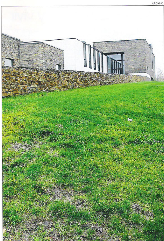
La puerta de entrada de Grandas de Salime, que se abrirá este año

En cuanto a los primeros pobladores, los testimonios más antiguos de la ocupación humana de estas tierras se remontan a hace más de 300.000 años.