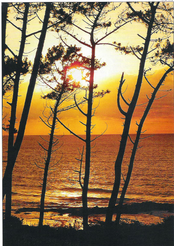
Te esperan espectaculares puestas de sol y playas, como esta de Frejulfe

Iniciaremos la subida hacia el interior de la comarca, visitando la exposición de la Casa de la Apicultura y el núcleo rural de Froseira donde se con