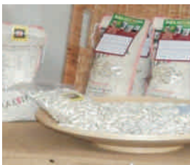
Descubre la faba asturiana "La Estela" (Coaña)