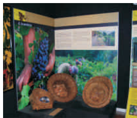
Museo Etnológico de Pesoz