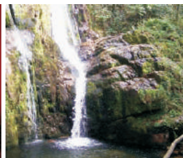
Paseo libre hasta las cascadas de Oneta (Villayón)