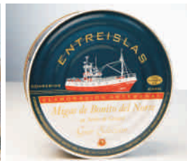
Descubre las esencias del mar "Conservas Entreislas" (El Franco)