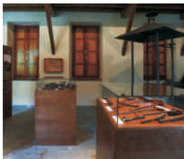
Visita guiada al C I de la Artesanía del Hierro(Boal)