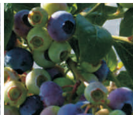
Caminando entre arándanos "Caxigal" (Grandas)