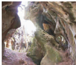
Visita guiada por "As Covas da Andía" (El Franco)