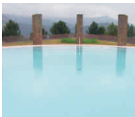
Centro de recreo de Folgueiróu (Illano)