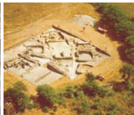
Visita guiada por el Chao Samartín (Grandas)