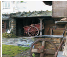
Visita al Museo Etnográfico de Grandas