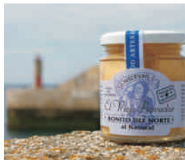
Conserva la tradición de "El Viejo Pescador" (Tapia)