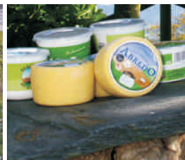
La buena leche de vaca "Quesería Abredo" (Coaña)