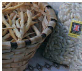
Descubre la huerta asturiana "Finca la Huerta" (Navia)