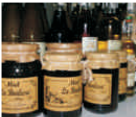
Con la miel en los labios "La Boalesa" (Boal)