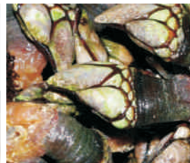
Rula que rula en Puerto de Vega (Navia)