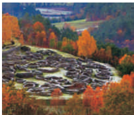
Visita guiada por el Castro de Coaña